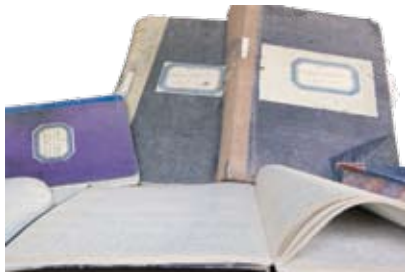
Πρακτικά του Δήμου Λεμεσού από το 1878